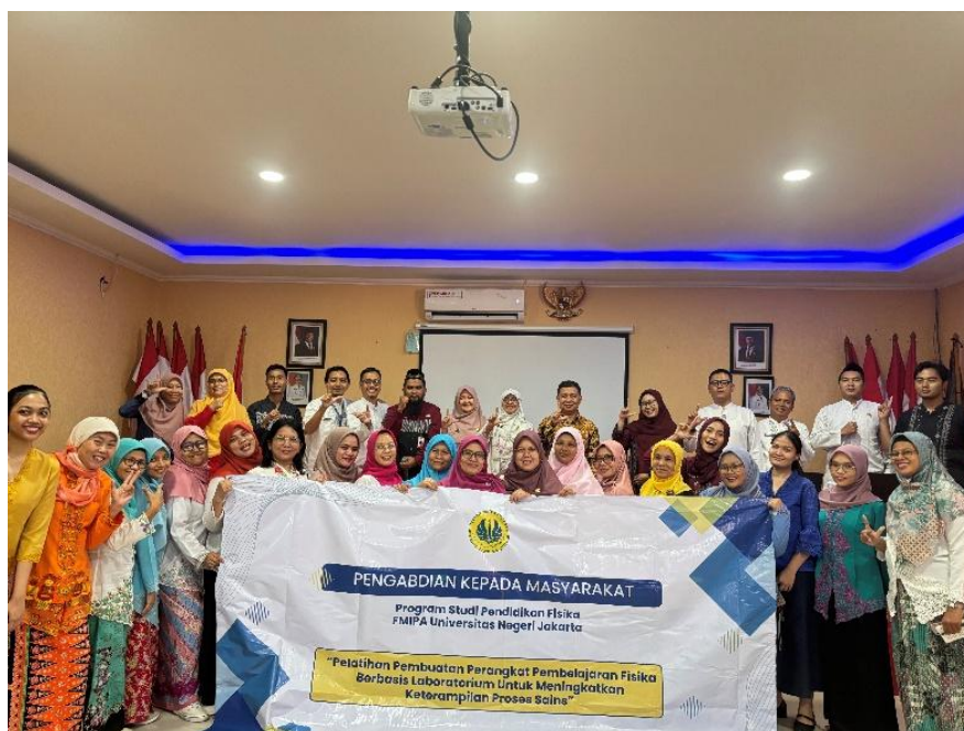
GAMBAR 4. Dokumentasi Kegiatan Pelatihan

Kegiatan diakhiri dengan sesi refleksi dan pengumpulan umpan balik melalui formulir umpan balik. Umpan balik diberikan melalui layanan digital Google Form yang dibagikan setelah kegiatan materi telah selesai dilakukan. Hasil umpan balik dapat dilihat pada TABEL 1.