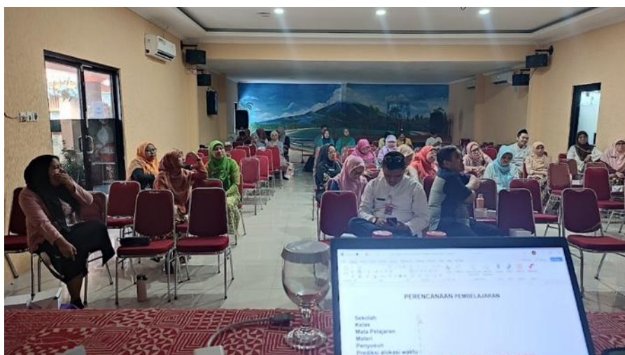
GAMBAR 3. Diskusi Dinamis Peserta dan Tim

Sesi pelatihan tetap berlangsung secara interaktif dan produktif. Para peserta tetap mengikuti pemaparan materi dan melakukan diskusi ketika tim UNJ menyajikan contoh-contoh LKPD sederhana untuk menumbuhkan keterampilan proses sains siswa. Diskusi berkembang secara dinamis ketika peserta diminta mengidentifikasi bagian-bagian dari LKPD yang dapat diintegrasikan dengan aktivitas laboratorium. Banyak peserta berbagi pengalaman mengenai kondisi laboratorium di sekolah masing-masing, mulai dari keterbatasan alat, minimnya waktu praktik karena padatnya kurikulum, hingga kurangnya pelatihan khusus bagi guru untuk mengembangkan perangkat pembelajaran berbasis eksperimen. Beberapa guru menyampaikan bahwa meskipun sekolah mereka memiliki ruang laboratorium, peralatan yang tersedia tidak selalu lengkap atau layak pakai. Situasi ini menyebabkan sebagian besar praktikum hanya sebatas demonstrasi oleh guru, bukan eksplorasi mandiri oleh siswa.