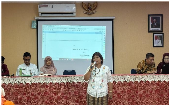
GAMBAR 2. Pembukaan kegiatan pelatihan

pembelajaran berbasis laboratorium melalui tayangan visual, tanpa aktivitas praktik mandiri oleh peserta.