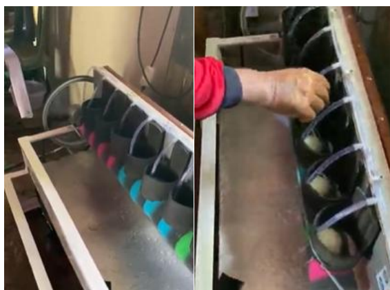
GAMBAR 4. Pemasangan dan Uji Coba SalTED Duck Egg Washer Machine

Pada sisi pengetahuan teknologi, mitra yang sebelumnya belum mengenal sistem otomasi kini mampu memahami prinsip kerja mesin dan melakukan perawatan dasar secara mandiri. Pelatihan berbasis praktik langsung membantu mitra beradaptasi dengan cepat terhadap teknologi baru. Hal ini menjadi indikator keberhasilan transfer IPTEKS antara tim pengabdian dan pelaku usaha.