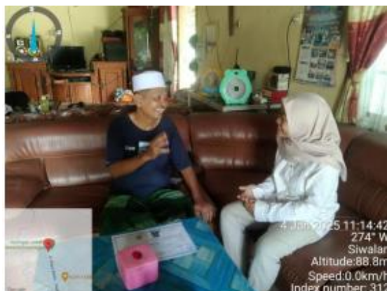
GAMBAR 2. Observasi Bersama Mitra

menunjukkan adanya kesenjangan antara potensi produksi yang dimiliki mitra dengan efektivitas proses dan manajemen usaha yang dijalankan.