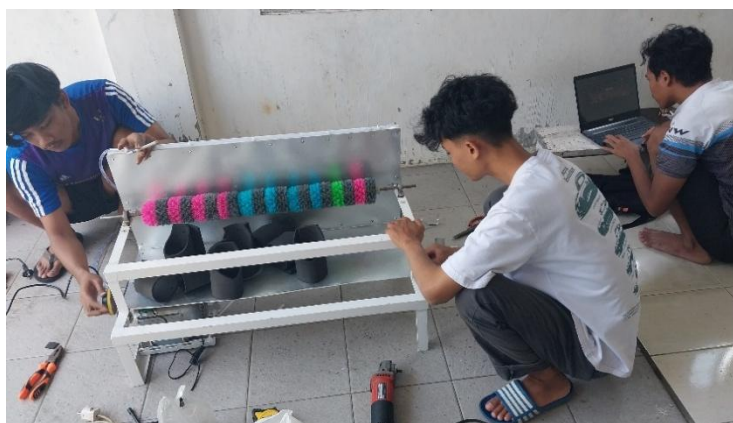
GAMBAR 3. Perancangan Salted Duck Egg Washer Machine

Pada tahap pemecahan masalah, tim pengabdian mengidentifikasi dua persoalan utama, yakni pada aspek produksi dan manajemen usaha. Dari sisi produksi, permasalahan utama berkaitan dengan efisiensi dan kebersihan dalam proses pencucian telur. Untuk mengatasinya, tim merancang Salted Duck Egg Washer Machine, sebuah alat otomatis dengan sistem motor penggerak, roll sikat, dan semprotan air bertekanan. Penggunaan alat ini terbukti mampu mempercepat proses pembersihan sekaligus meningkatkan higienitas produk. Uji coba menunjukkan bahwa waktu pencucian yang semula membutuhkan sekitar 15 menit per batch (30–40 butir) berkurang menjadi 8 menit per batch, dengan penggunaan air yang lebih hemat hingga 60%. Hasil pencucian juga tampak lebih bersih dan merata tanpa sisa kotoran, sehingga siap langsung diproses ke tahap pengasinan.