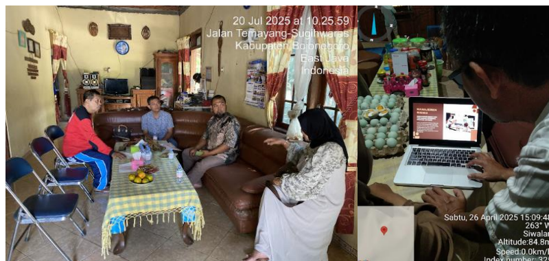
GAMBAR 5. Implementasi Penggunaan Mesin dalam Proses Produksi Harian

profesional. Langkah ini berdampak positif terhadap citra produk dan meningkatkan daya saing di pasaran.